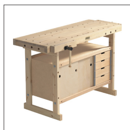
Sjöbergs Nordic 1450 + 0042