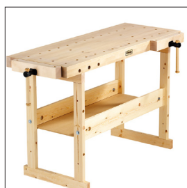
Sjöbergs Nordic 1450

1010x430x100 mm 39 49/64 x16 59/64 x 3 15/16 in