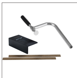
Tillbehörsats Nordic 1450