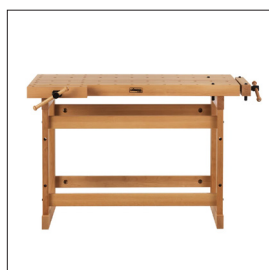
Sjöbergs Nordic Pro 1400 Art nr 33338

Skåp SM07 1070x510x95 mm 42 1/8 x20 5/64 x 3 47/64 in