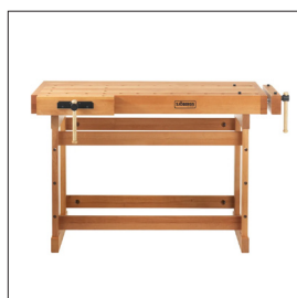
Sjöbergs Scandi 1425 Art nr 33280