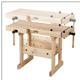
Sjöbergs Junior/Senior Art nr 33503

530x455x45 mm 20 55 / 64 x17 33 / 64 x 1 49 / 64 in