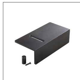
Universal Amboss, einstellbar Art nr 33617