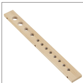
Werkzeugeleiste Art nr 33362