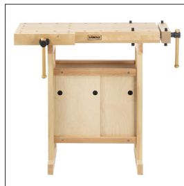
Sjöbergs Junior/Senior + 0022 Art nr 33365