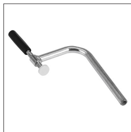
Spannswinge ST03 Art nr 33637