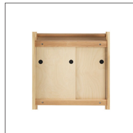
Sjöbergs 0022 Art nr 33394