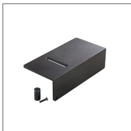
Universal Amboss, einstellbar Art nr 33617