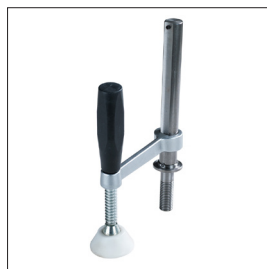
Spannzwinde ST11 Art nr 33639