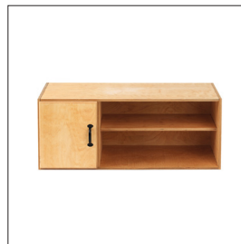
Sjöbergs SM07 Art nr 33273