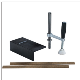
Zubehörsatz Sjöbergs Scandi Art nr 33301