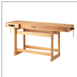
Sjöbergs Scandi 1825 Art nr 33279

4 Bankhaken sind stets Teil des Lieferumfangs.