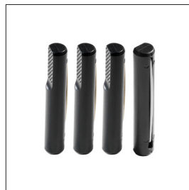
Bankhaken, rund Art nr 33290