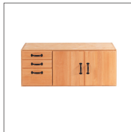
Sjöbergs SM03 Art nr 33457