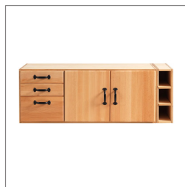
Sjöbergs SM05 Art nr 33818