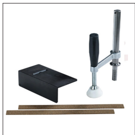
Zubehörsatz Original 1900 Art nr 33829