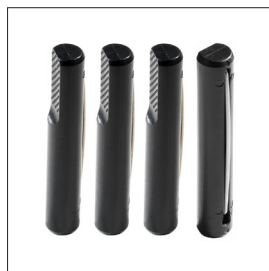
Bankhaken, rund Art nr 33290