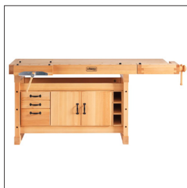
Sjöbergs Original 1900 + SM05 Art nr 35008