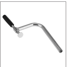
Spannschwinge ST03 Art nr 33637