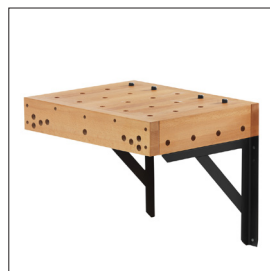
Sjöbergs Clamping Platform Art nr 33467