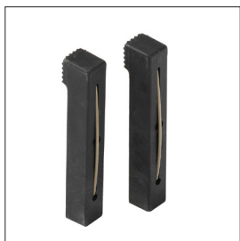
Bankhaken, eckig Art nr 33291