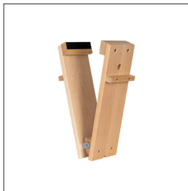
Feilklupe Art nr 33492