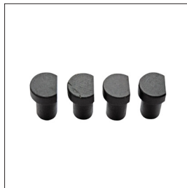
Bankhaken, runden Art nr 33317