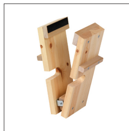
Feilklupe Art nr 33492