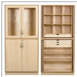
Sjöbergs Schrank 1, Glas-/ Birkentür, Textilien Vorschlag Art nr 38029