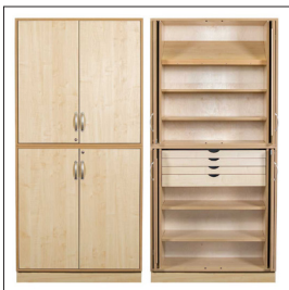
Sjöbergs Schrank 1, Birkentür, Werkräume Vorschlag Art nr 38009